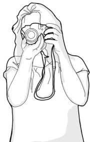
Candice - photographe